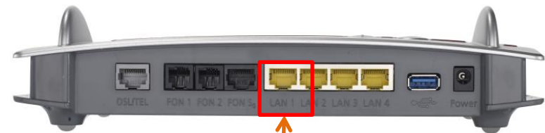
Endgerät (Beispiel FritzBox 7490)

Bei Verwendung eines eigenen Endgerätes enden unsere Serviceleistungen an der CPE.